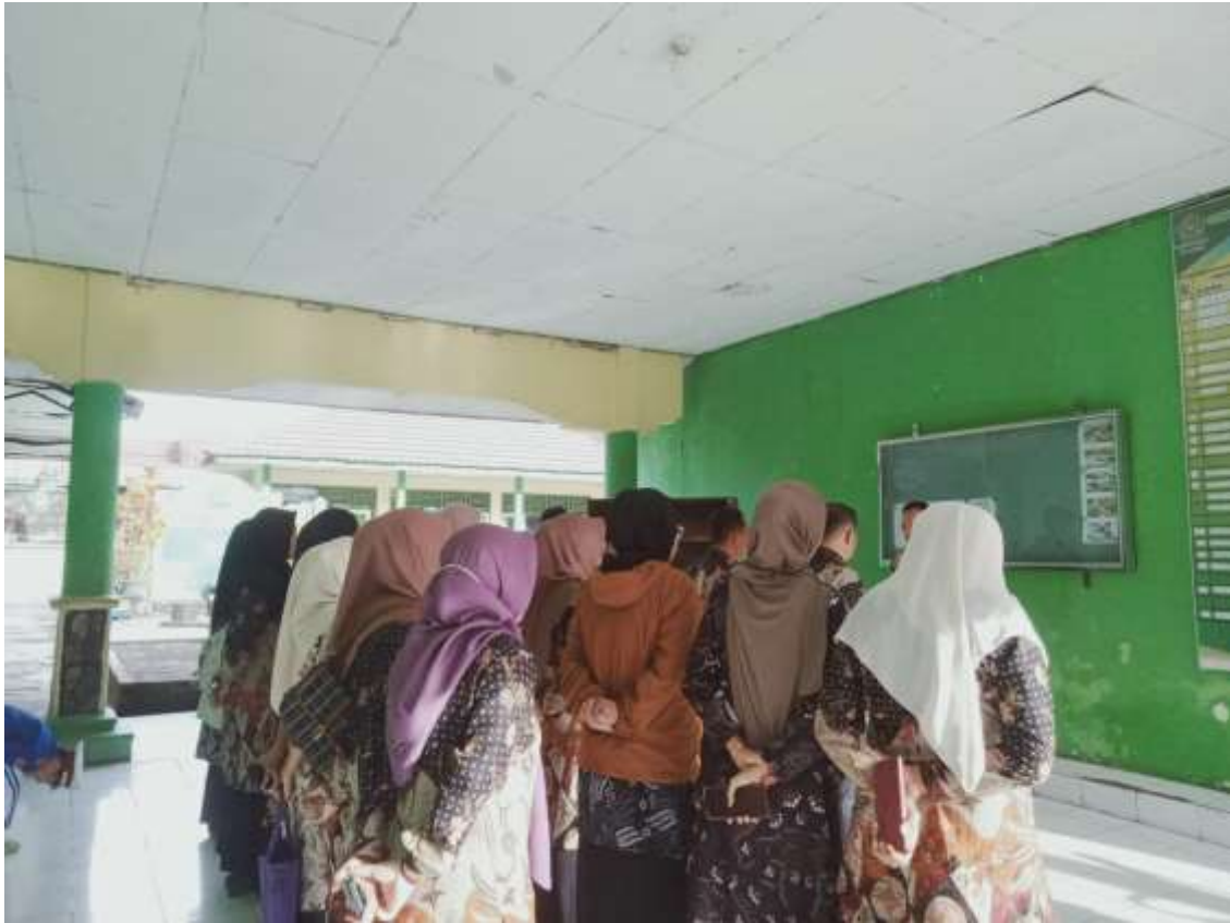
Apel pagi di MAN 1 Kepahiang