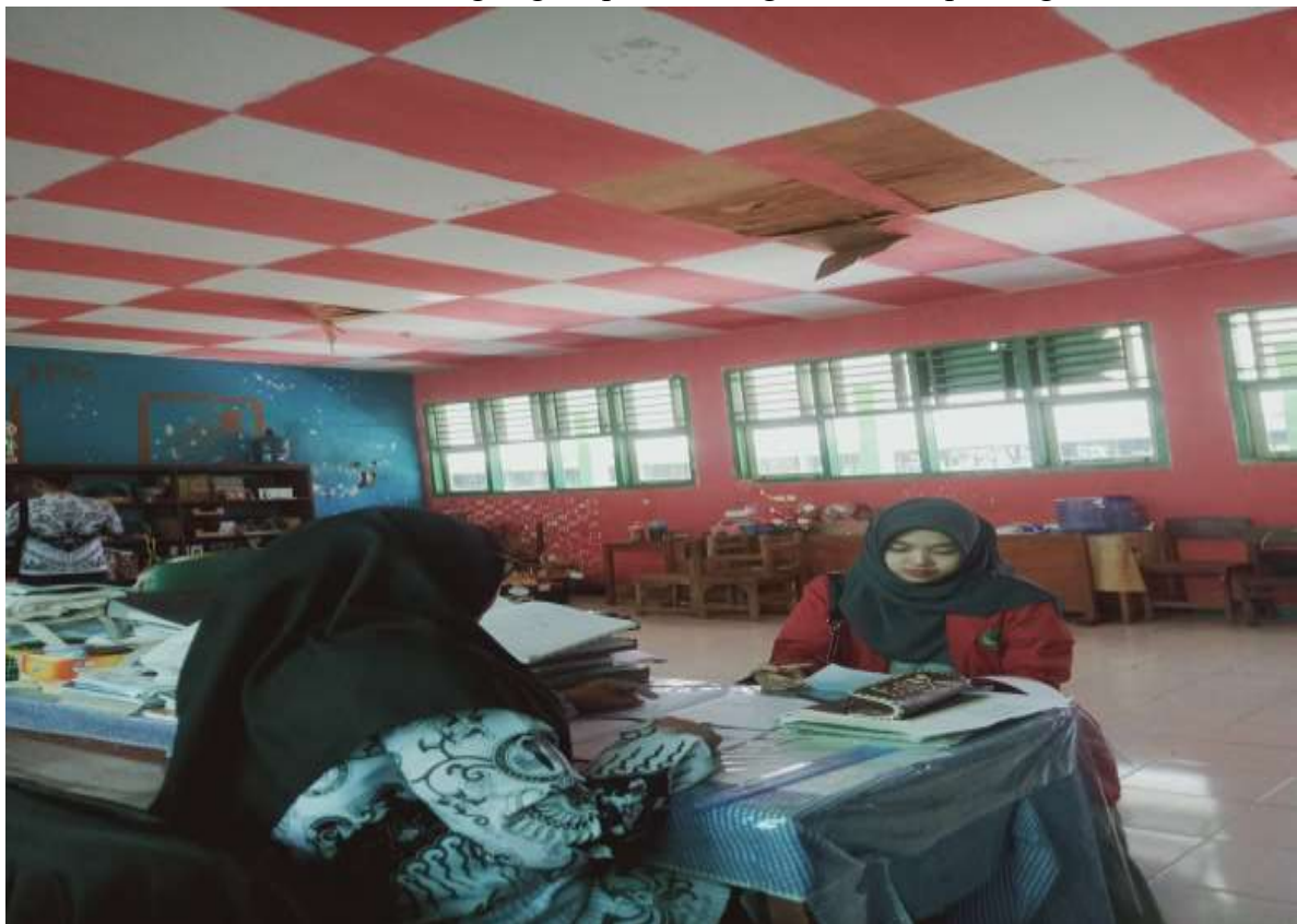
Wawancara dengan wali kelas XII MAN 1 Kepahiang