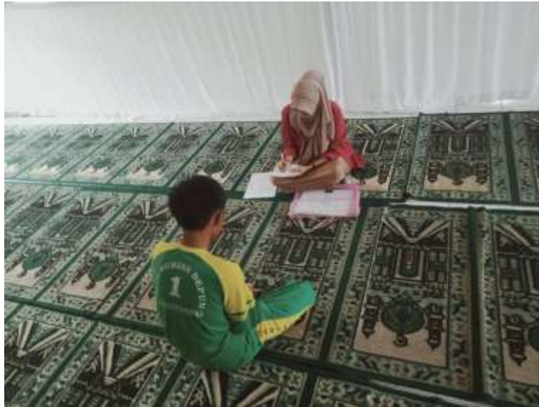
Wawancara siswa kelas XII (MH) MAN 1 Kepahiang