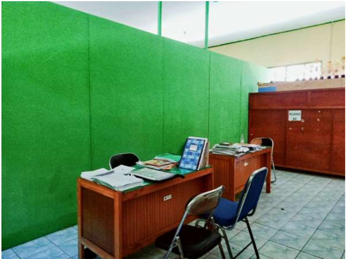
Ruang BK MAN 1 Kepahiang