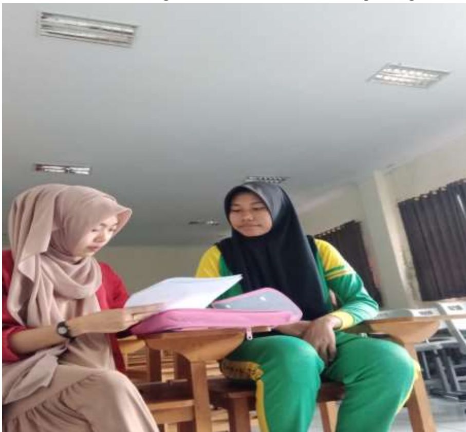
Wawancara dengan siswa kelas XII MAN 1 Kepahiang