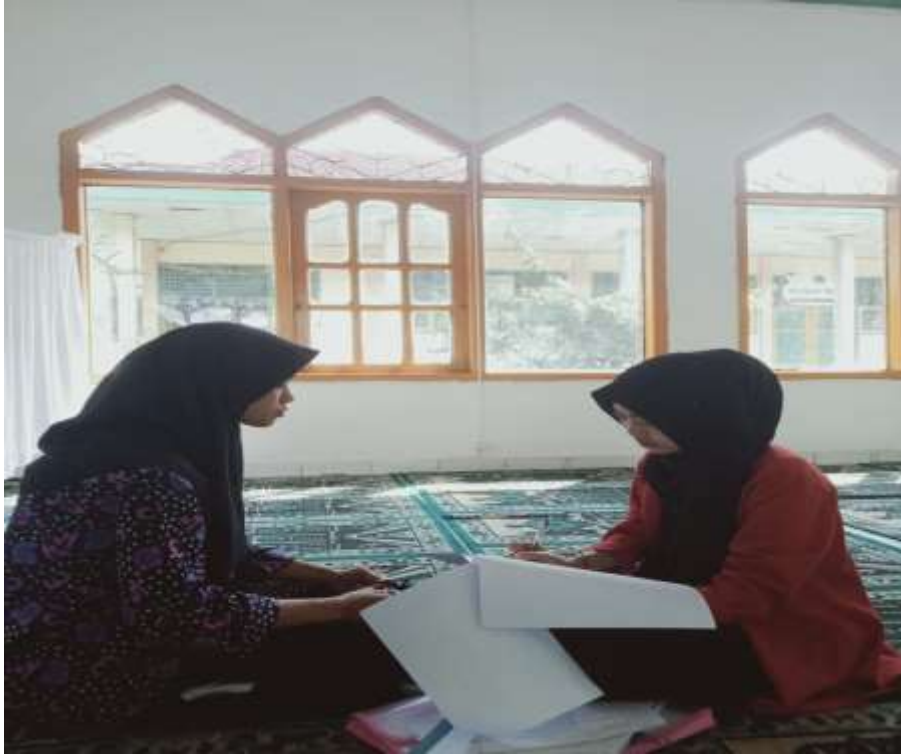
Wawancara dengan siswa kelas XI MAN 1 Kepahiang