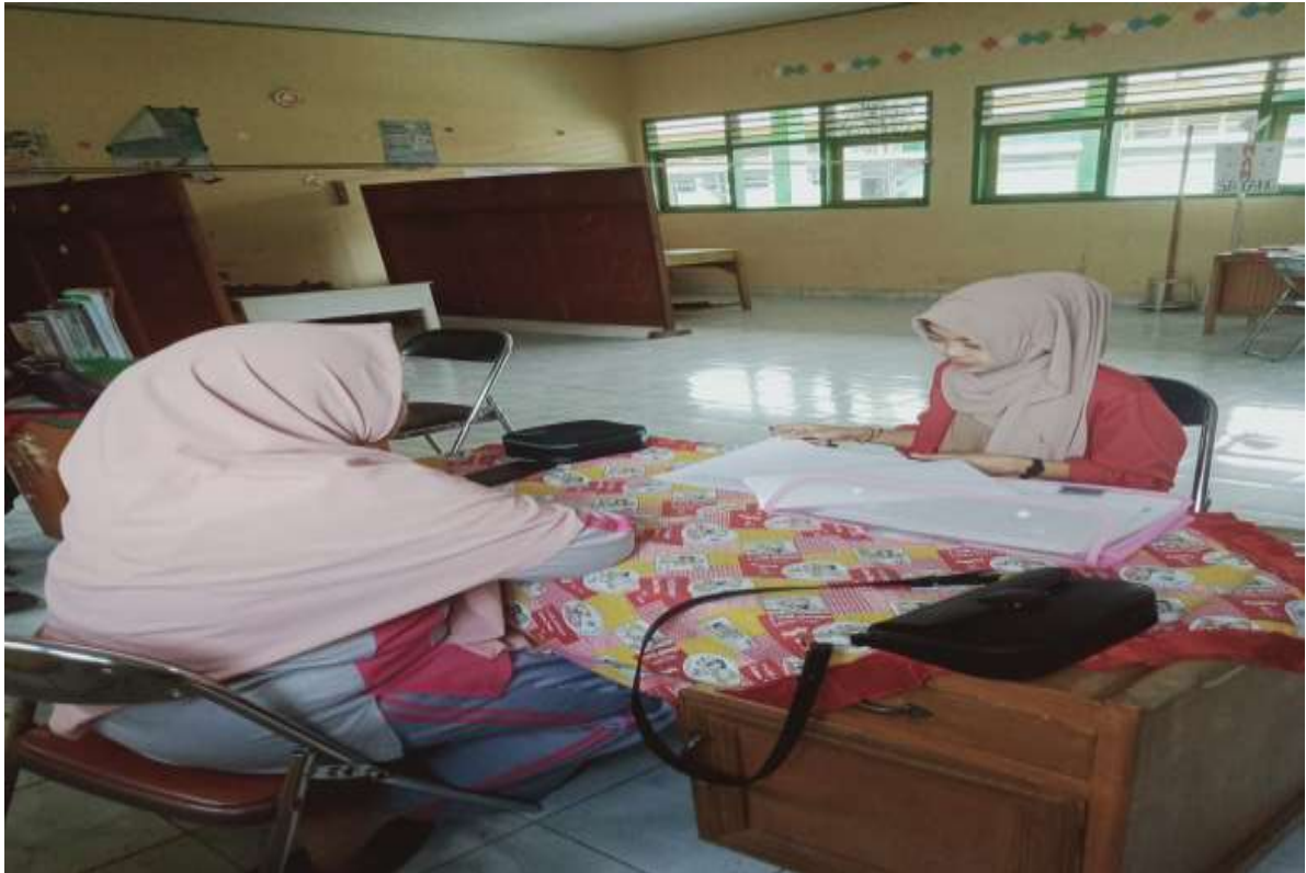
Wawancara dengan guru pembimbing MAN 1 Kepahiang