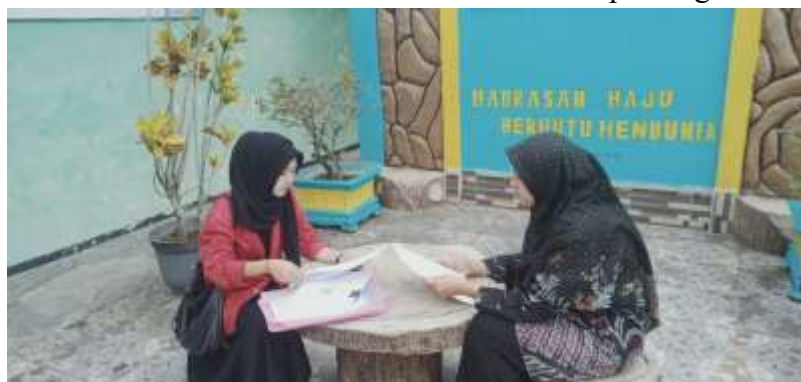
Wawancara wali kelas XI MAN 1 Kepahiang