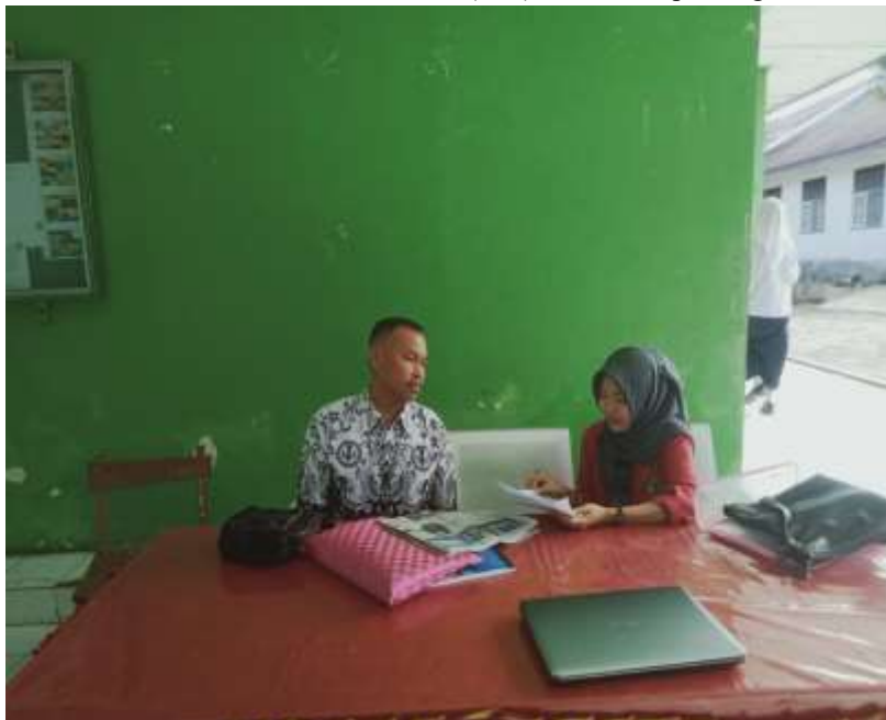
Wawancara wali kelas XII MAN 1 Kepahiang