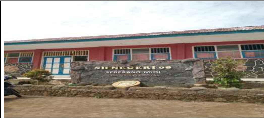
Gambar 4.1 SDN 08 Seberang Musi