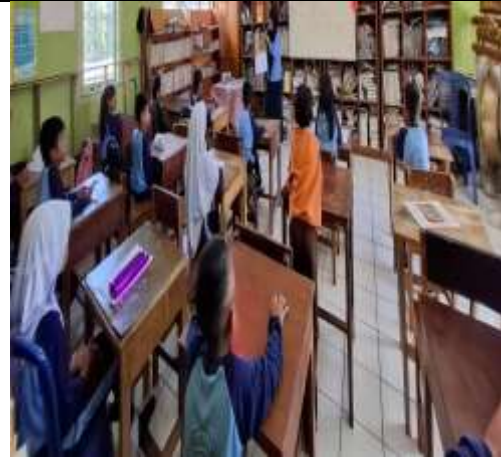
Gambar 4.2 Proses penggunaan media flip chart