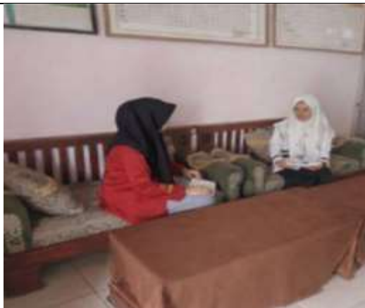
Gambar 4.3 Wawancara dengan Kepsek