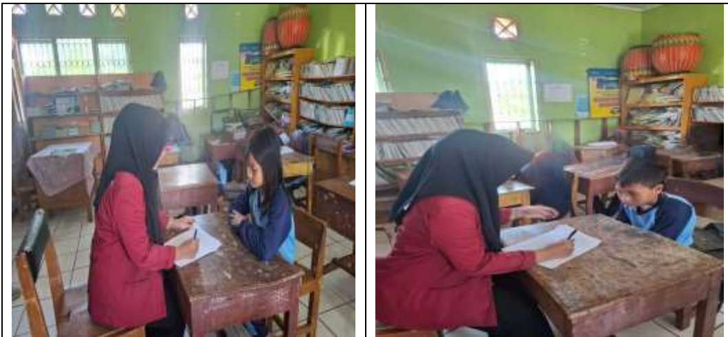
Gambar 4.5 Wawancara dengan siswa