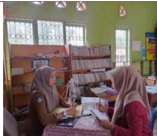
Gambar 4.4 Wawancara dengan Guru PAI