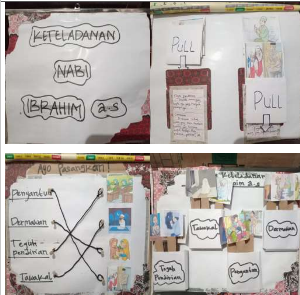
Gambar 4.6 Foto media flip chart