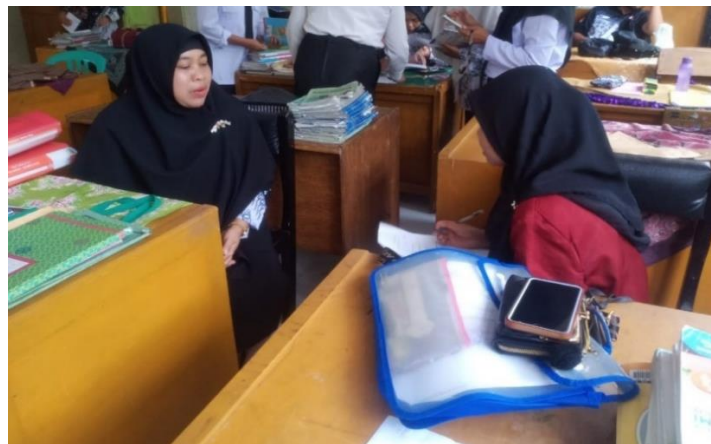
Wawancara dengan wali kelas