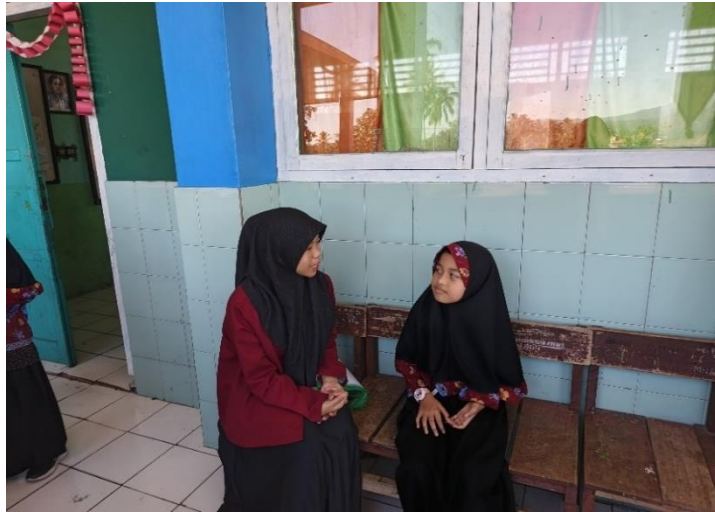
Wawancara dengan siswa/siswi MIN 1 Rejang Lebong