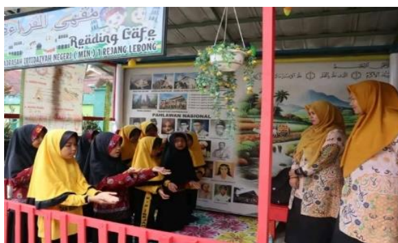
Gambar 4.3 Persiapan kegiatan peringatan Isra Miraj 158

“Setiap masuk kelas kami baco doa dulu, terus salam. Pas ketemu guru jugo salam samo disuruh senyum jugo. Terus kalo ngomong dak boleh kasar, kalo ado yang ketauan ngomong kasar gek di tegur kek guru.” 157