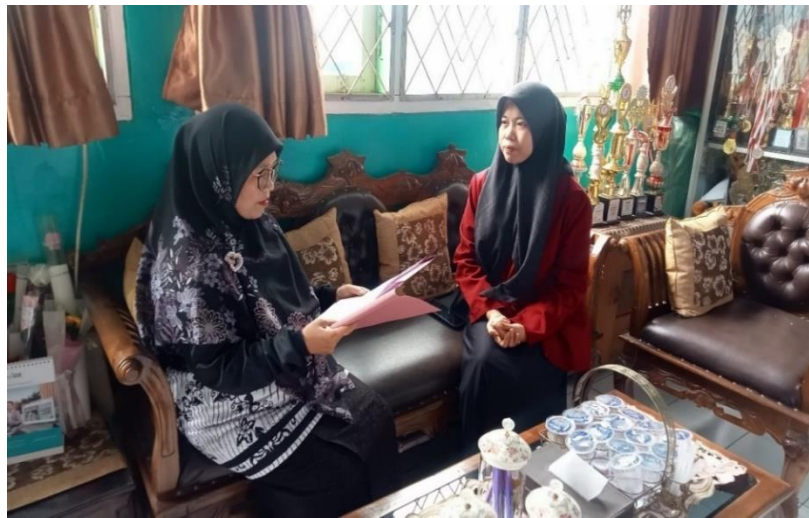
Wawancara dengan kepala MIN 1 Rejang Lebong