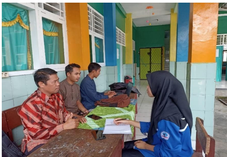
Wawancara dengan koordinator keagamaan MIN 1 Rejang Lebong