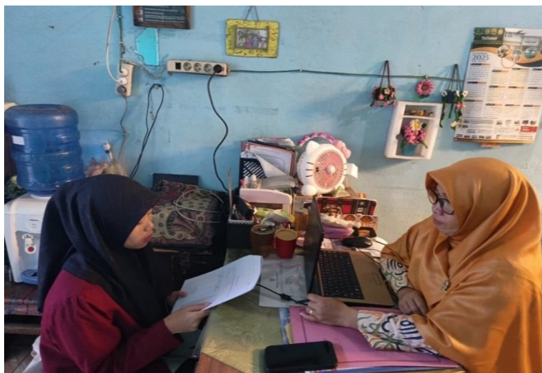
Wawancara dengan waka kesiswaan