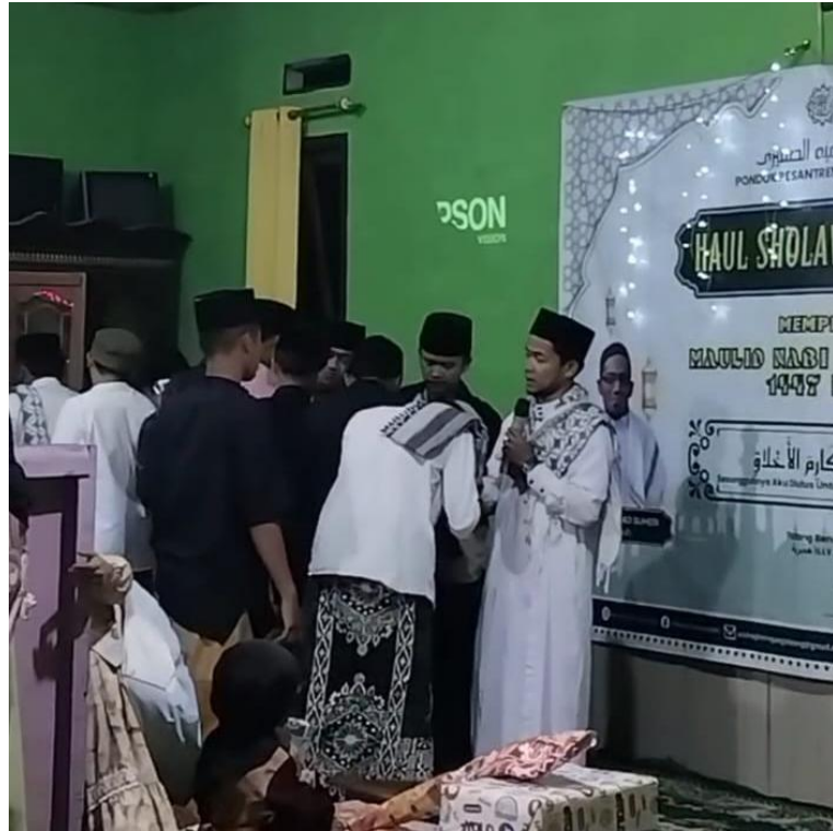
Gambar 4.4 Santri Bersalaman Saling Memaafkan