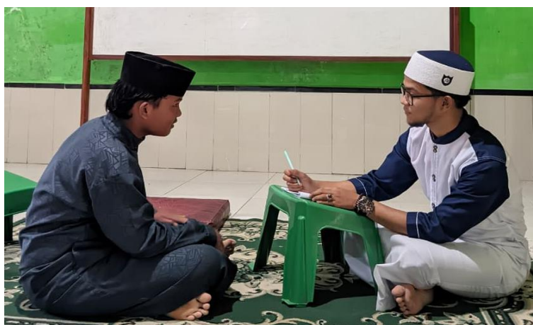
Wawancara Koordinator Santri Pesantren Asshohiri