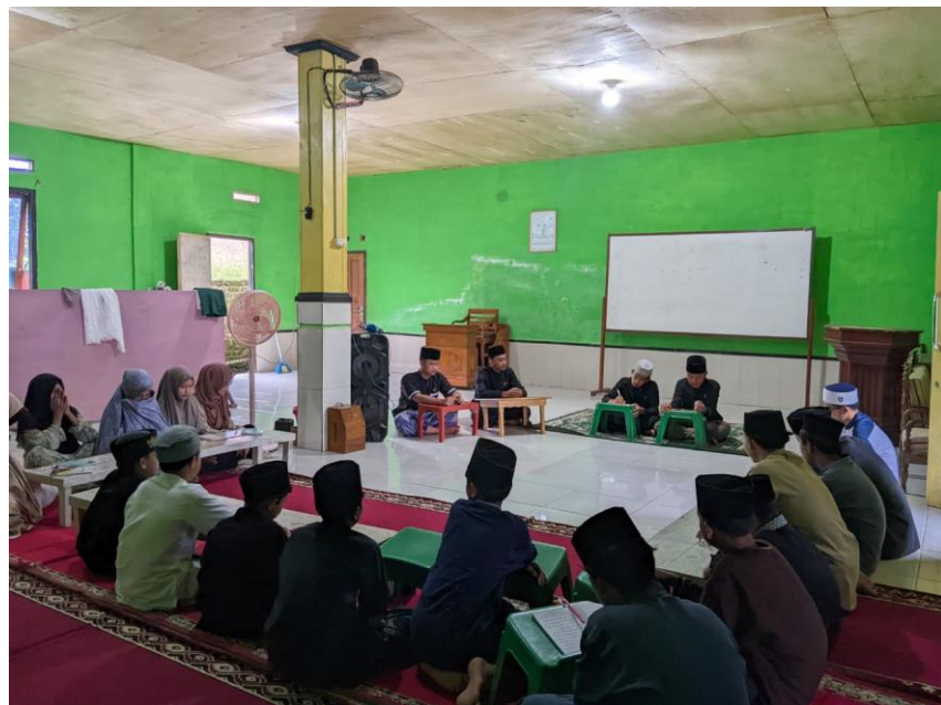
Gambar 4.3 Pelaksanaan Mudzakarah