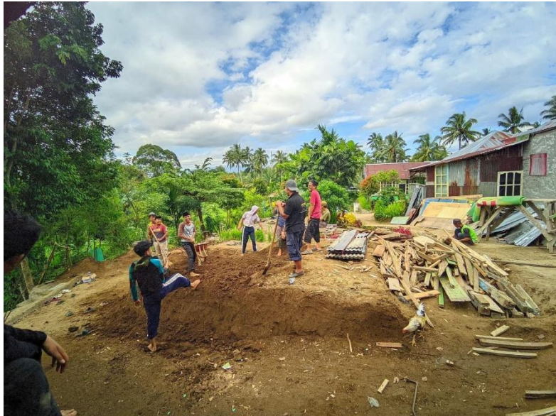
Gambar 4.5 Ukhuwah Islamiyah Santri