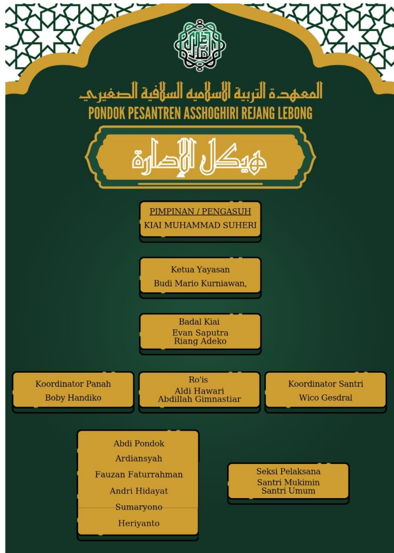
Gambar 4.2 Struktur Pondok Pesantren Asshoghiri