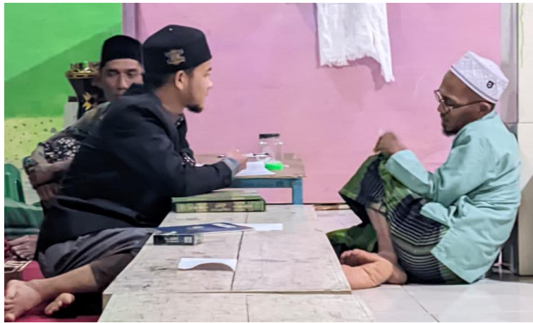
Wawancara Pengasuh Pondok Pesantren Asshohiri