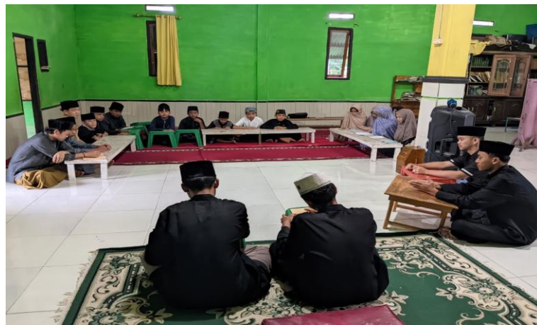
Diskusi Pemateri dan Santri Yang didampingi Badal dan Ro'is