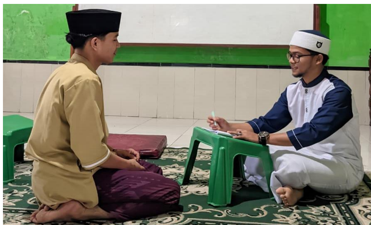
Wawancara Ro'is Pesantren Asshohiri