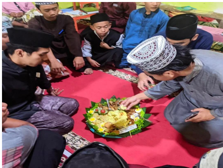
Gambar 4.6 Sifat Tawadhu' Santri