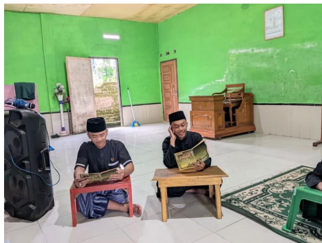
Gambar 4.7 Ro'is Menasehati Santri