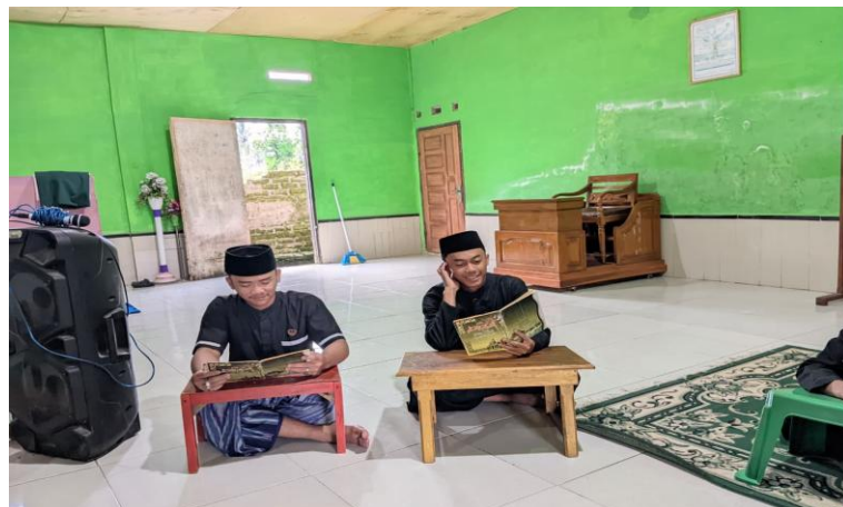
Badal Memberikan Kesimpulan Akhir