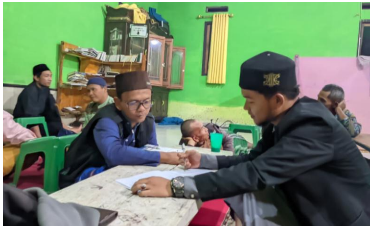
Wawancara Badal Pesantren Asshohiri