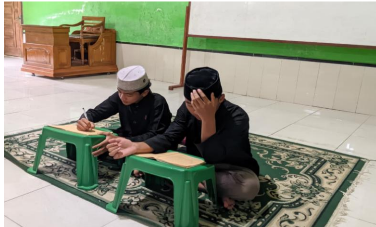
Pembacaan Kitab Oleh Pemateri