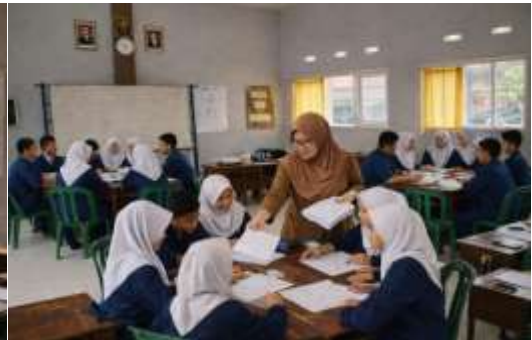
Guru Memberikan lembar kerja siswa (LKS) yang dikerjakan secara bersama