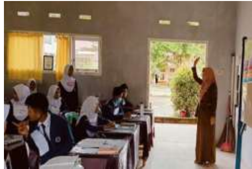
Guru Menyampaikan materi pembelajaran sebagai pengantar