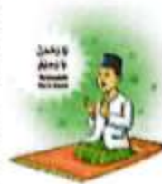
Gambar 2.1 Siswa yang sedang berdoa

Untuk berdekatan dengan Allah Swt, tentu kita harus mengenal-Nya. Salah satu caranya adalah menelaah sifat-sifat-Nya dalam al-Azma' al-Husna .