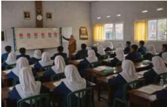
Guru menjelaskan konsep dan tatacara penerapan model Collaborative Learning

Untuk memperkuat temuan penelitian yang diperoleh melalui observasi dan wawancara, peneliti menggunakan dokumentasi sebagai data pendukung. Berikut hasil dokumentasi: