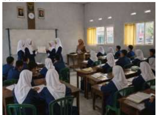
Kelompok mempresentasikan hasil diskusi di depan kelas