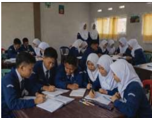
Siswa bekerja sama dan saling membantu dalam memahami materi pembelajaran