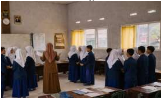
Guru Membagi peserta didik ke dalam beberapa kelompok