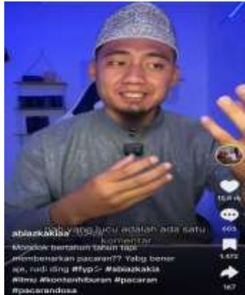
Gambar 4.5 contoh isi konten akun ustadz abiakakiaa

Selain akun Tiktok, ustadz abi azkakaiaa juga memiliki media sosial lainnya untuk berdakwah yaitu: