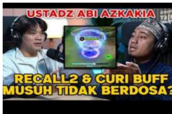
Gambar 4.1 Podcast Empetalk Ustadz Abi

langsung dalam akun media sosialnya. Ustadz Abi Azkacia mulai tenar dan terkenal dengan cukup ramai setelah tampil sebagai tamu di podcast Empetalk Jonathan Liandi pada 13 September 2022. Karena berdakwah sambil bermain Mobile Legends, game yang paling disukai anak-anak zaman sekarang. 34