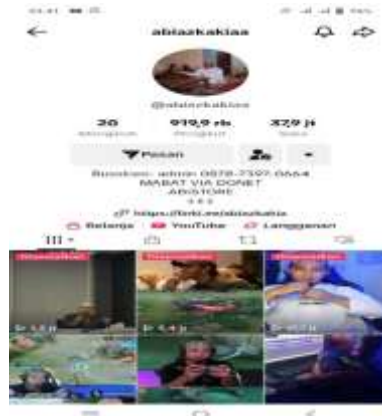
Gambar 4.2 profil ustadz abi azkakiaa

Dalam isi konten akun TikTok Ustadz Abi Azkakia yang memiliki username @abiazkakiaa memiliki variasi konten. Menyajikan berbagai macam video, mulai dari video singkat mengenai dakwah, hiburan seperti pembahasan game dan QnA dan kegiatan sosial dari Ustadz Abi Azkakia, konten endorsement atau iklan, dan konten pribadi bersama keluarga. Berdasarkan hasil foto screenshot di atas, akun TikTok Ustadz Abi Azkakia dengan followers yang berjumlah 919.900 (per Februari 2024) dan likes berjumlah 37.900.000 likes.