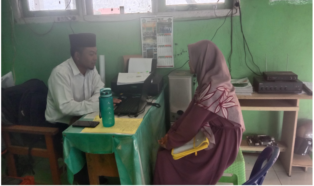
مقابلة مع أستاذ مصباح العلوم المنير، ليسانس