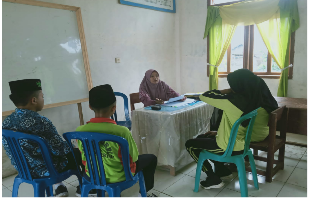
مقابلة مع تلاميذ في معهد مفتاح الجنة