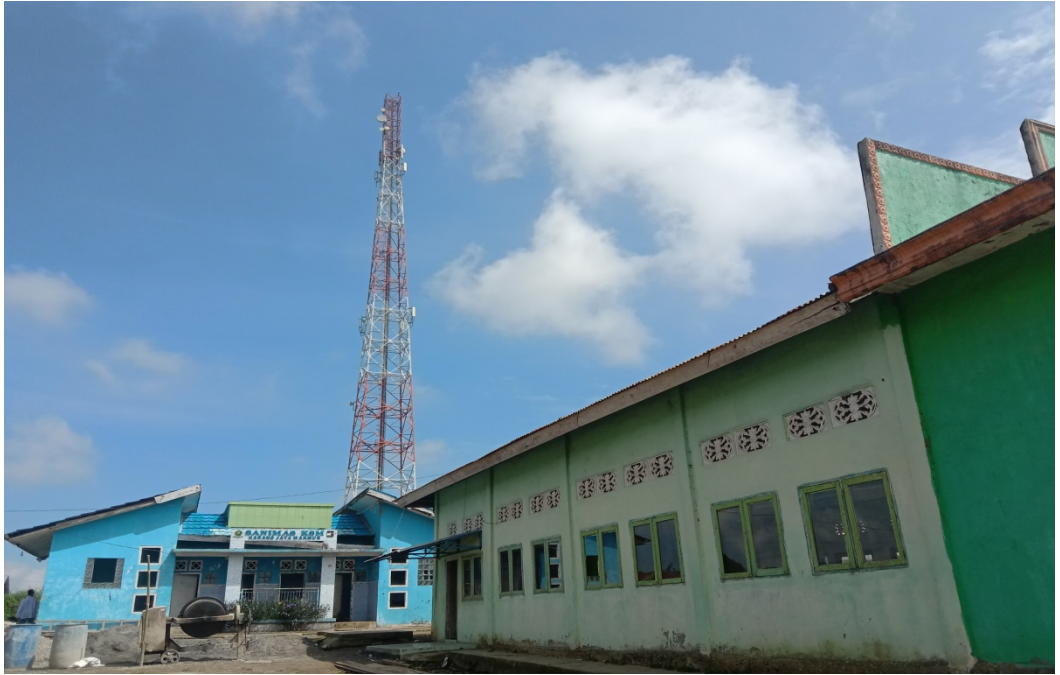
فصل مدرسة دينية معهد مفتاح الجنة كارانج جايا