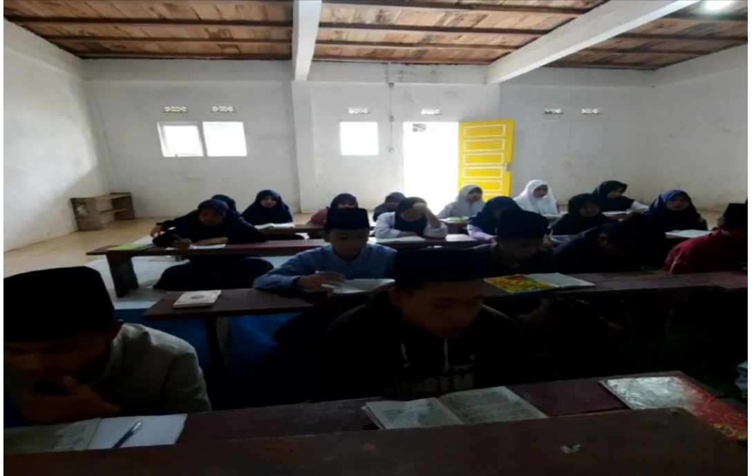
تعلم النحو في معهد مفتاح الجنة