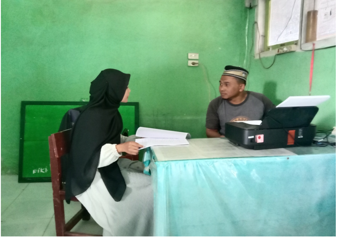
مقابلة مع أستاذ مصباح العلوم المنير، ليسانس