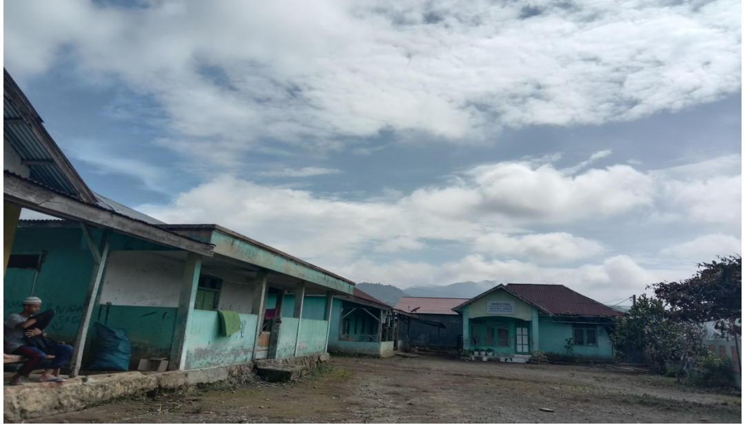
غرفة النوم لطلاب في معهد مفتاح الجنة