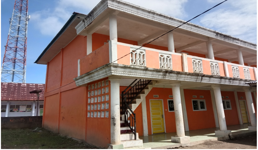
غرفة النوم لطلبة في معهد مفتاح الجنة