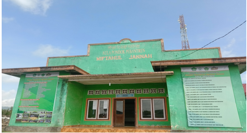
معهد مفتاح الجنة كارانج جايا