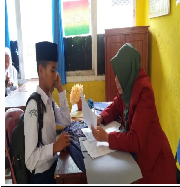
مقابلة مع التلاميذ