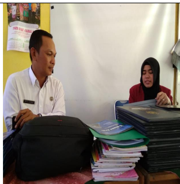
مقابلة مع معلم اللغة العربية