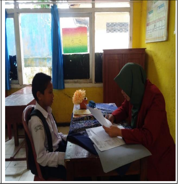
مقابلة مع التلاميذ