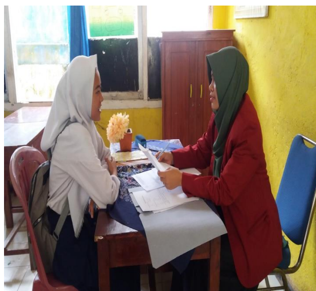
مقابلة مع التلاميذ