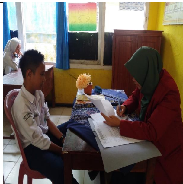
مقابلة مع التلاميذ