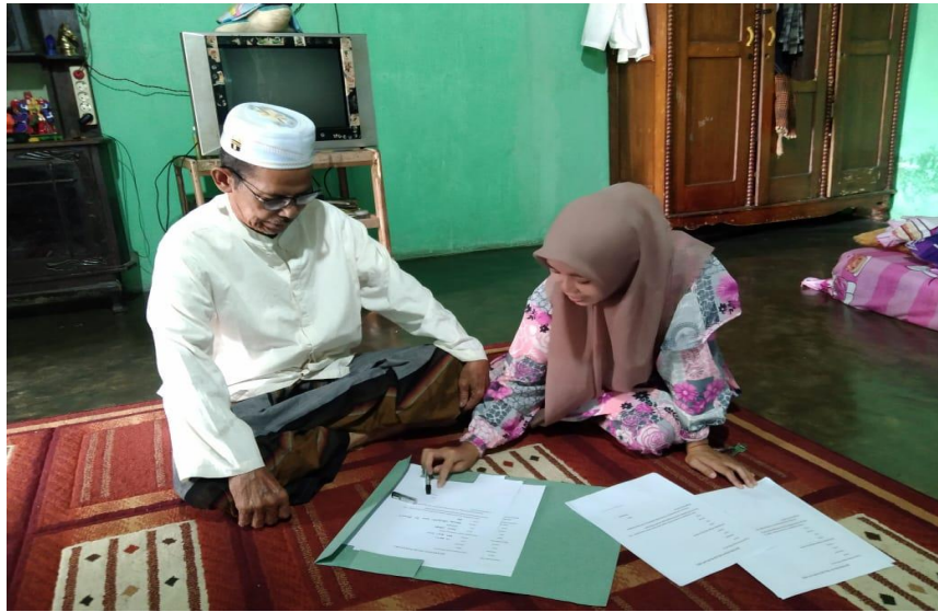
Kegiatan photo dengan Tokoh Agama Masyarakat Desa Maur