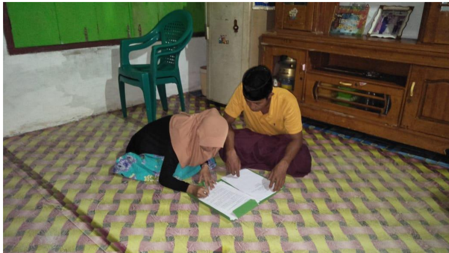
Kegiatan wawancara dengan kepala Desa Maur