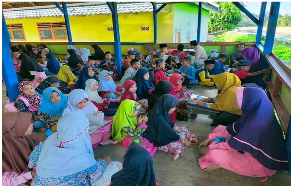
Kegiatan Pengajian anak-anak pada sore hari