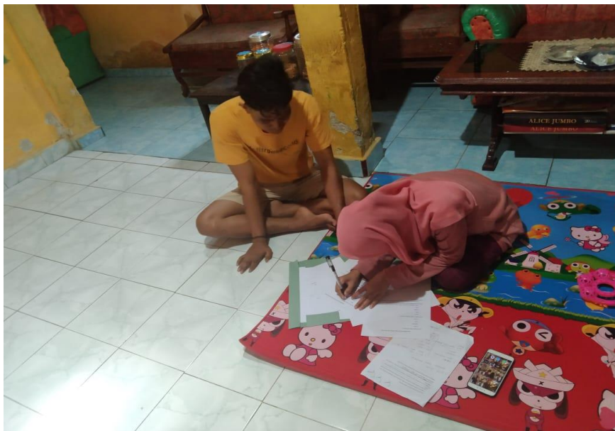
Kegiatan wawancara dengan masyarakat Desa Maur