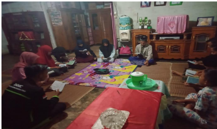
Kegiatan Rutin Remaja pengajian setiap malam jumat dari rumah ke rumah Desa Maur