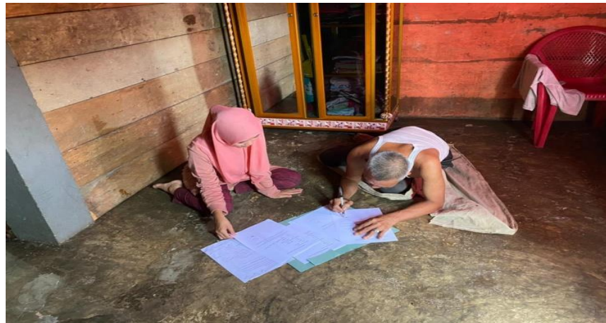
Kegiatan photo dengan tua Masyarakat desa Maur